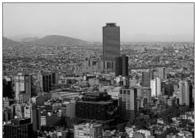
La ciudad de México es una de las más pobladas del planeta.

Tras la Segunda Guerra Mundial, los países subdesarrollados se incorporaron a la revolución demográfica y se inició la fase actual de crecimiento general acelerado. En 1950 la población mundial era de 2.500 millones de habitantes; en tan sólo cuarenta y cinco años esta cifra se ha duplicado, hasta superar los 5.500 millones en 1995. En los últimos decenios, cada año tiene lugar un incremento de unos 70 millones de personas. Según cálculos de la UNESCO, si se mantiene este ritmo de crecimiento, en el año 2.015 poblarán el mundo unos 7.200 millones de personas, cifra que podría verse duplicada a finales del siglo XXI.