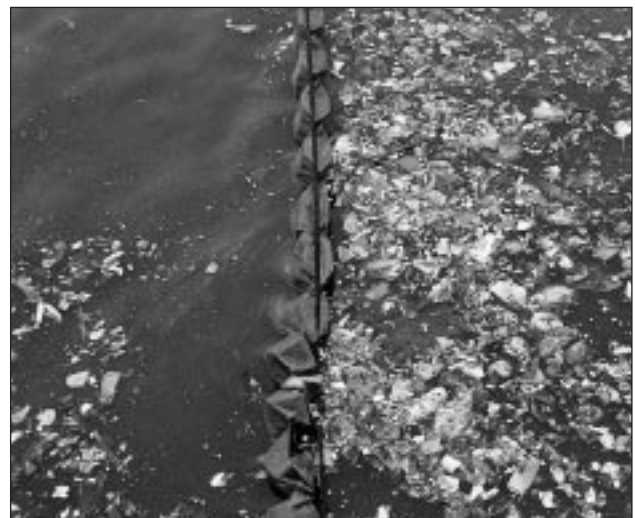
Los plásticos se degradan muy lentamente, por lo que suponen una importante amenaza para el medio ambiente.

Sin embargo, aún desconocemos los riesgos ecológicos y para la salud humana que presentan muchos de los miles de productos químicos sintéticos disponibles actualmente en el mercado.