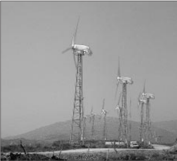
En la central eólica de Tarifa (Cádiz) se aprovecha la fuerza del viento para la producción de energía.