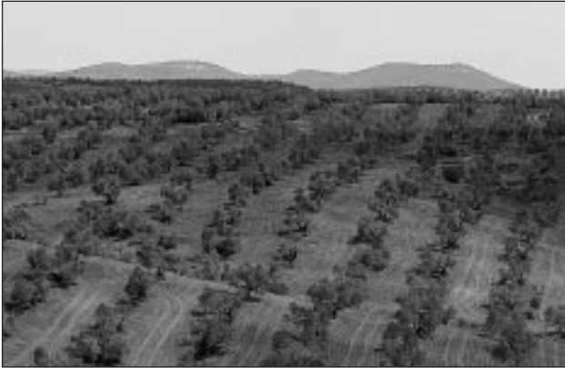
El cultivo del olivar en fuertes pendientes, habitual en Andalucía, genera la pérdida y degradación de los suelos.

A lo largo de la Historia, el proceso de transformación de la Naturaleza emprendido por el ser humano con el objetivo de extraer recursos ha ido alterando lentamente la composición de las poblaciones animales y vegetales, las características del biotopo y los ciclos de nutrientes, sobre todo los del carbono y el nitrógeno. Cuando estas alteraciones suponen riesgos para los ecosistemas o para la vida humana, hablamos de problemas ambientales .