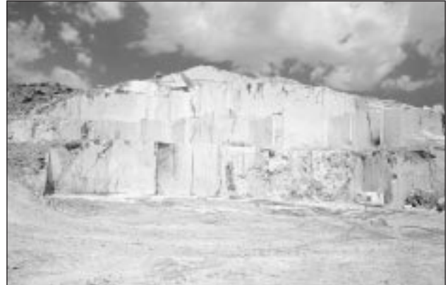
Las rocas y minerales son recursos no renovables a escala de tiempo humano. Cantera de mármol en Macael (Almería).

Recursos son todos los bienes naturales, que pueden servir para satisfacer directa o indirectamente las necesidades humanas. Algunos recursos, como la energía solar, el aire, el agua, el suelo y las plantas y animales silvestres, están disponibles en grandes cantidades para nuestro uso y el de los demás seres vivos. Pero otros, como el aluminio, el petróleo o las aguas subterráneas, son limitados y sólo pueden obtenerse tras mucho esfuerzo por medio de la aplicación de ingenios tecnológicos.